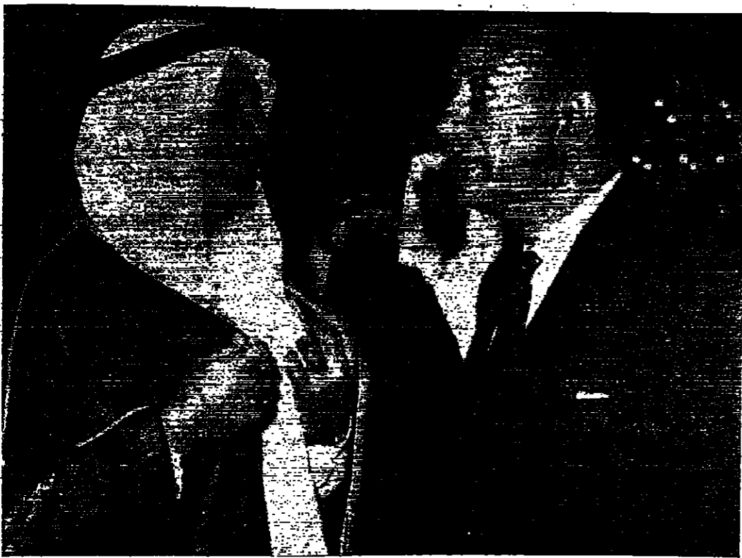
السيد محمود رياض وزير خارجية الجمهورية العربية المتحدة والشيخ عمر السقاوي وزير الدولة المصري للشؤون الخارجية يمشيان في حديقتهما